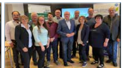
Ökoregion südl. Waldviertel