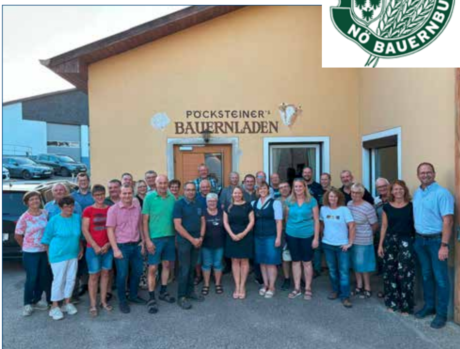
Hofgespräch der Ortsgruppen Hofamt Priel, Persenbeug Gottsdorf