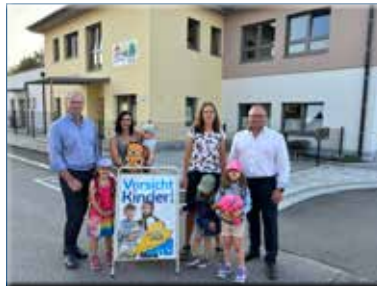
Kindergarten u. Tagesbetreuung