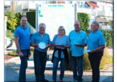
Essen auf Räder