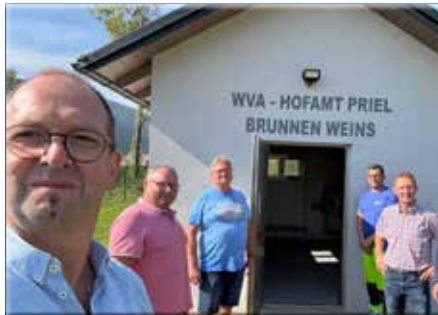
Sanierung Brunnen Weins