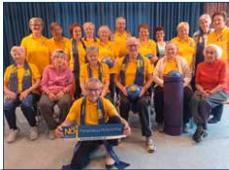
Turnen im Gemeindezentrum

Wieder darf ich sie über unsere Aktivitäten informieren, Sie vielleicht auch auf den Geschmack bringen, bei uns einmal zu schnuppern, mit zu machen und die Gemeinschaft so richtig zu genießen.